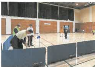
グラウンドゴルフ