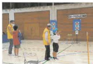
スポーツウエルネス吹矢