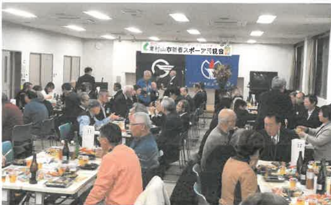
和やかな会場の様子