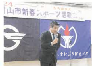
木原誠二衆議院議員