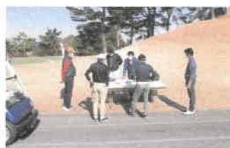
ゴルフ 競技説明は屋外で各組ごとに

今年度も、大会当日には、体育協会の役員と職員が伺い、各競技団体の大会運営の確認、ご苦勞された点などを共有させていただいております。