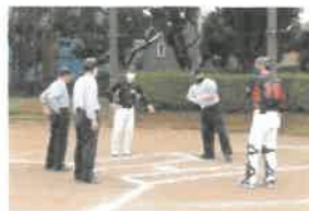
試合前の挨拶は代表のみ