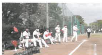
ベンチでも十分な距離を確保