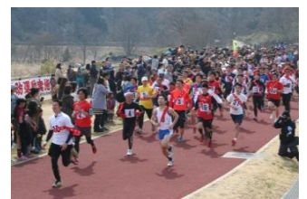
駅伝の部スタート