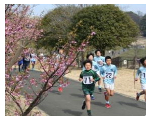
春を感じながら、駆け抜けます