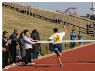
ガッツポーズでゴール