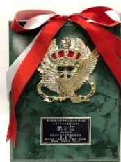
惜しくも準優勝となったソフトテニス 女子