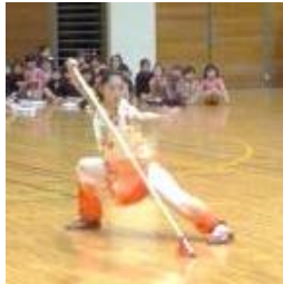
太極拳連盟の華麗な表演