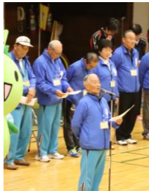
朝岡会長のあいさつ