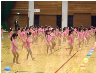
精心幼稚園児によるダンス