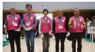
団体 1 位 東村山センター支部・カワセミ

日にち：10月22日(日) 会場：駒沢オリンピック公園 屋内球技場 参加数：104 チーム 520 人 東村山市スポーツ吹矢協会から 4 チーム 20 名