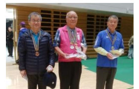
個人戦 2 位 (中央)