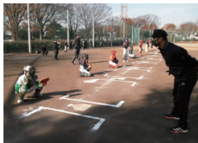
少年軟式野球連盟によるジュニア育成事業

技団体のうち16競技が実施されました。競技団体が様々な場面を想定した上で感染対策を策定し、大会参加者への周知と徹底を呼びかけました。開催に当たっては体協役員と事務局職員の2名体制で、策定した対策に沿った大会運営がされているかどうかの立ち合いを行いました。ソーシャルディスタンスが保たれていないなど幾つかの問題が見られましたが、その場で改善を求め予定された大会を実施、大会2週間後の安全確認も行いました。 さて、人はなぜ声援を送るのでしょうか。皆さんは普段、誰を応援していますか。子ども、好きな選手、それとも自分自身。応援や声援は、自己満足なのか、また、勝敗に関係するものなのか。ある企業が、ハンドボールの強豪校で、無観客の前半戦と、観客を入れて応援される状態での後半戦で違いを検証しました。結果、観客に応援されることで選手の運動量が約20%アップするということが証明されました。選手も観客がいるとモチベーションが上がります。「良いプレーをしたい」という気持ちから自然と体が動いていましたと、コメントしていました。確かに、ハンドボールに限らず、タイム競技で言えば、普段の練習では、出なかつた記録が本番で出たということも納得がいきます。応援・声援は、勝敗に大いに関係する、人が応援されると頑張れることが分かりました。 コロナ禍によって、心も身体も落ち込みがちで今だからこそ、普段の日常を取り戻すために、自分自身に声援を送り、子どもたちを応援し、地域を応援し、みんなが繋がって頑張っていきたい。そして、スポーツを通じて、心も身体もいつまでも元気で、笑顔あふれる、「たのしみ」な毎日をお過ごしただけのこと、心から願っております。