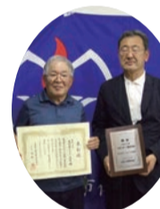
ソフトボール連盟