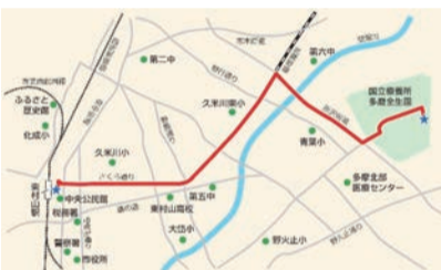
市内の聖火リレールート

聖火が市内にやってきました。次に東京2020大会への出場が期待される市にゆかりのある選手たちを紹介します。1人目は市内出身(野火止小学校、東村山第三中学校を卒業)で、リオデジャネイロ2016オリンピックに続いてオリンピック2大会連続出場を狙う陸上400mのウォルシュ・ジュリアン選手(富士通陸上競技部所属)です。オリンピックでの目標は、予選で日本記録を出し、決勝の舞台でどこまで行けるか挑戦したいと話していました。なお陸上400mは8月1日(日)に予選が、2日(月)に準決勝が、5日(木)に決勝が、それぞれオリンピックスタジアムで行われます。 続いて紹介するのは市内のロードスポーツを強化拠点に活動し、コロナ禍の市内店舗をスタンプラリーで盛り上げる『東村山エールラリー』にご協力いただいたトライアスロンの古谷純平選手(市内在住)、小田倉真選手、パラトラ