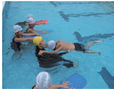
小学校での水泳指導

シニアは、①スポーツウエルネス吹矢、②ラジオ体操、③卓球、④ターゲットボード・ゴルフの4種目を実施しました。このコロナ禍において、ジュニアでは、各種目ともに日本のトップによる指導が行われ、子供たちが短期間に成長しました。シニアでは、改めてスポーツの楽しさを体験することができました。 今年度は新型コロナウイルス感染拡大防止の対策を各主管団体が徹底して実施しました。そ