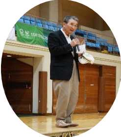
市川会長のあいさつ