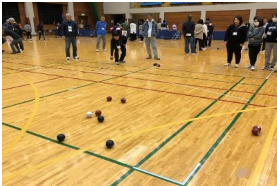
ナイスショット！ ボッチャのゲームは各コートで盛り上がりました