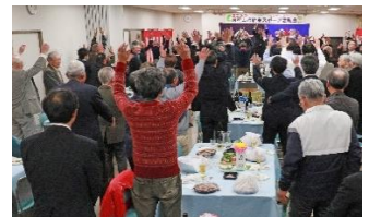
万歳三唱にて閉会