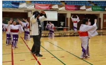
東京五輪音頭-2020- 振付の表している意味が わかりました