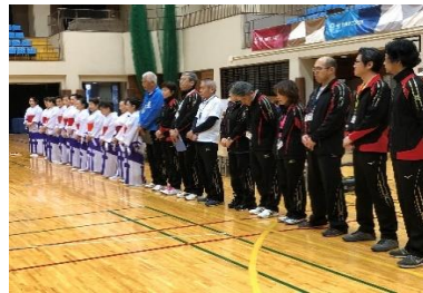
講師 東村山市民踊連盟 東村山市スポーツ推進委員