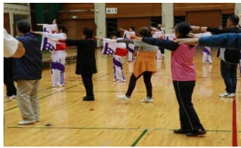
東村山音頭 やはり手の返しが難しい…