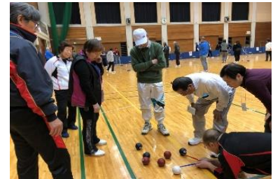
どちらのボールがジャックボール に近いかなあ？