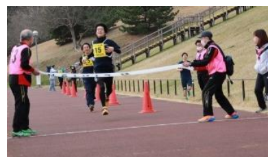
各自の力を発揮し、ゴール