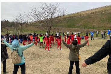
ラジオ体操会連盟による準備体操