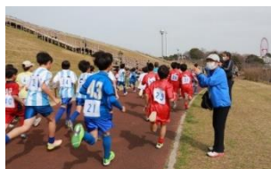
勢いよく飛び出していく選手たち