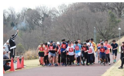
号砲とともにスタート!