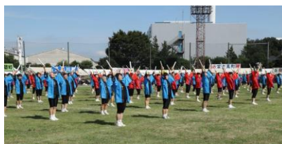
市民大運動会での一系乱れぬ公開演技

東村山市婦人軽体操連盟が令和5年3月31日付で東村山市体育協会を退会されました。長きにわたり、市民スポーツ振興への貢献、また当協会事業への多大なるご協力をいただきましたことに感謝いたします。ありがとうございました。