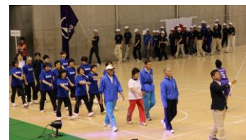
都民大会合同開会式での堂々とした行進