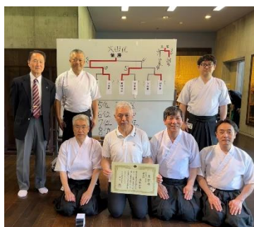
弓道連盟のみなさん